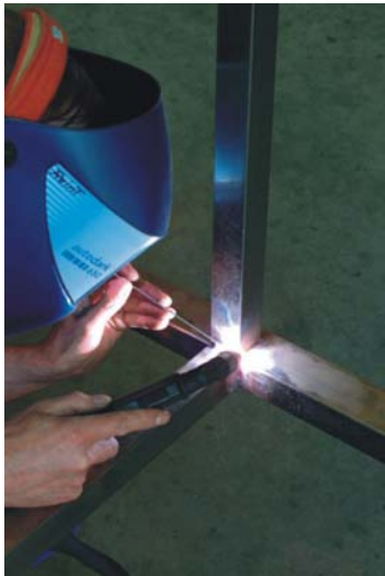
QuadraVA Rahmen geschweißt

Die dreiteilige Bauweise des QuadraVA-Konzepts erlaubt den Einsatz von Fahrgestellen mit serienmäßigen Achsbreiten (spurgleiche Achsen bei Einzelbereifung). Dadurch bietet ein Schlingmann-Löschfahrzeug optimale Fahrstabilität auch bei schwierigen Fahrbahnverhältnissen