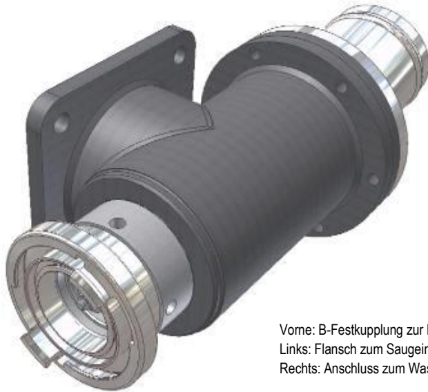
Vorne: B-Festkupplung zur Einspeisung Links: Flansch zum Saugengang der Pumpe Rechts: Anschluss zum Wassertank mit Rückschlagklappe