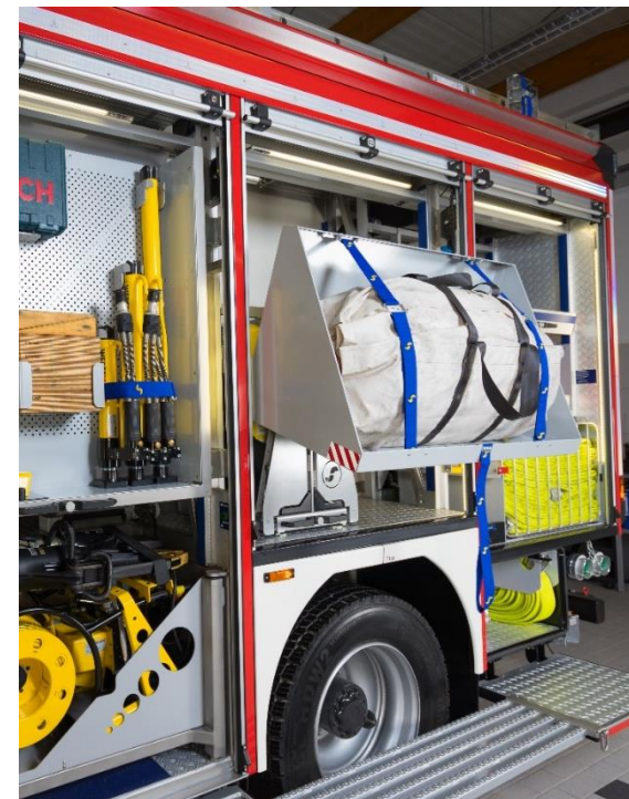
Gasdruckfederunterstützte Absenkung für optimale Entnahmehöhe.